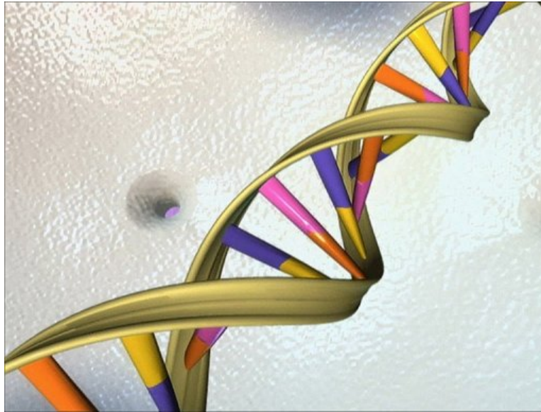
Une illustration de la double hélice de l'ADN

Alors que notre monde numérique croule sous la masse de données, des chercheurs européens viennent de faire la démonstration de l'étonnante capacité de l'ADN synthétique à stocker des textes, des images ou des sons.