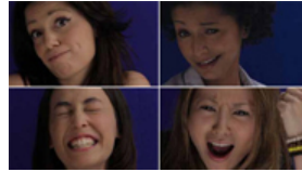
Terriennes : le portail consacré aux femmes