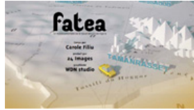
Web-documentaire : Fatea, le travail des femmes en Algérie