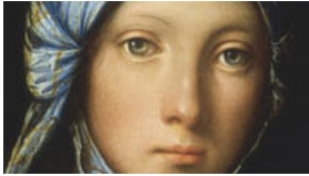
Galerie photo : l'exposition "Bohèmes" au Grand Palais